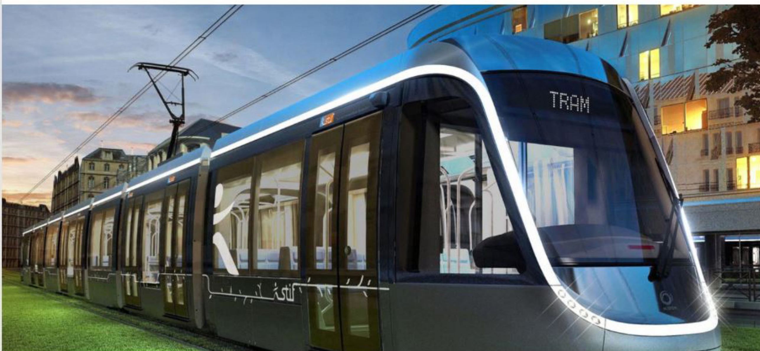
Ile-de-France Mobilités - Tramway T9