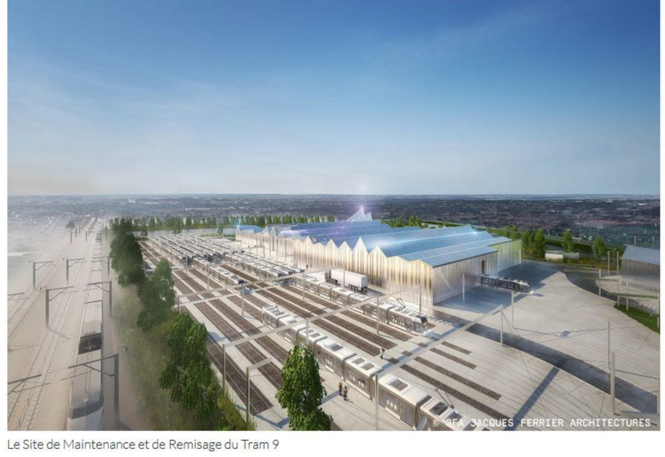
Le Site de Maintenance et de Remisage du Tram 9

Le Site de Maintenance et de Remisage est également en travaux à Orly afin d'accueillir les 22 rames de la flotte du Tram 9 et le Poste de Commandement Centralisé, qui aura la charge de gérer l'ensemble des fonctions de régulation de la ligne.